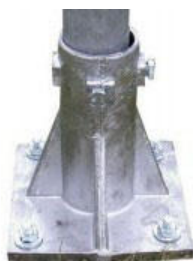
Vzorový obrázek kotvící patky

upravený terén a bude osazen v rostlé zemině. Nad upravený terén bude horní hrana vyčnívat max. 50 mm. Betonový prostý základ bude vybetonován do KG trubky, který bude sloužit i jako bednění pro vyčnívající část základů. Na horní plochu betonové patky bude osazena kotvící patka o rozměrech 250 x 250 mm a to pomocí 4 ks závitových tyčí vylepených na chemickou kotvu \varnothing 14 \text{ mm} . Kotvící patka bude pro průměr trubky 60 mm s bočními jistícími šrouby proti vytažení dopravní značky z otvoru patky.